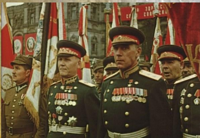
Перед Парадом Победы, 1945.