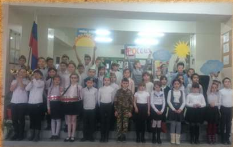
Конкурс инсценированной песни