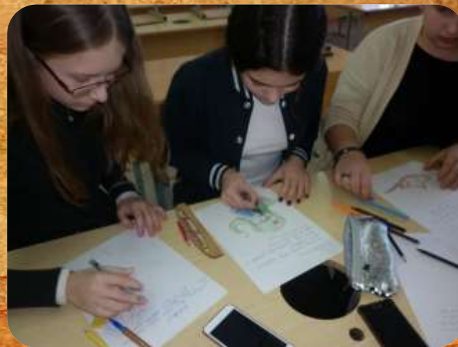
Акция «Письмо солдату»