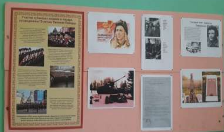
4 А КЛАСС ПРИСВОЕНО ИМЯ ЛАВРИНЕНКО Д.Ф.