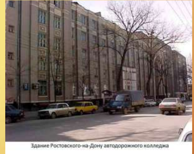
Здание Ростовского-на-Дону автодорожного колледжа