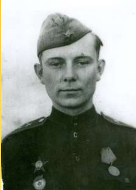
Присвоено звание Героя Советского Союза, 1943 г.