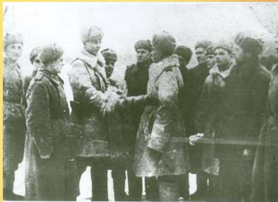
Вручение партийного билета

На фронте с июля 1942 г. Гвардии старший лейтенант, командир батареи 206-го гвардейского полка 3-й гвардейской Бахмачской легкой артбригады. Участник боев на Юго- Западном, Сталинградском, Центральном фронтах. Трижды ранен. Член КПСС с 1943 г.