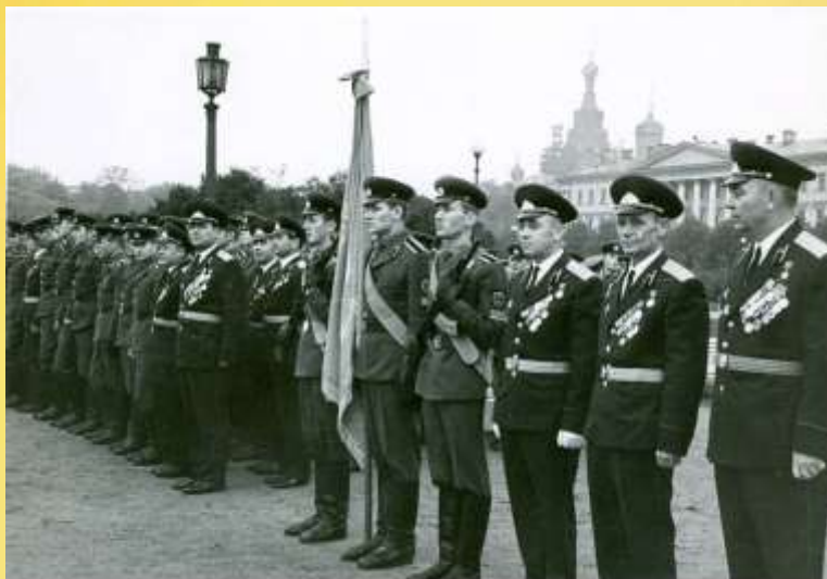
Во время приема Военской присяги курсантами Ленинградского высшего командного училища, 1969 г.

В 1945 году окончил Высшую артиллерийскую школу, в 1950 году – Военную академию имени Ф.Э.Дзержинского, в 1964 году – высшие курсы. Преподавал в военно-учебных заведениях. Был награжден орденом Ленина, орденами Отечественной войны 1-й и 2-й степени, Красной Звезды, медалями.