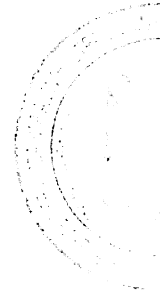
График проведения встреч агитбригады ГБПОУ «Ейский медицинский колледж» МЗ КК с учащимися общеобразовательных организаций в 2020 году